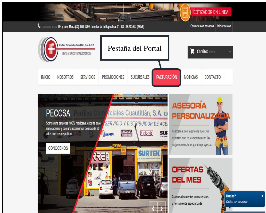
Imagen 1. Pestaña Facturación.