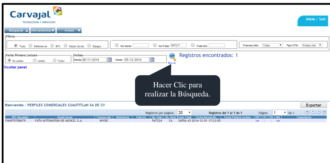
Imagen 4. Buscar Factura Electrónica.